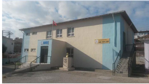
Görsel 1 : Eski Okul Binamız

Okulumuzun binası daha önce Süleyman Nihat Üzümcü İlkokulu olarak inşa edilmişti. 20 Kasım 2012 tarihinde okulumuz İmam Hatip Ortaokulu olarak Eğitim Öğretime başlamıştır. 16 Eylül 2013 tarihinde lise kısmı eğitim öğretime başlamış ve 09/05/2014 tarihinde okulumuz Lise çatısı altında hem Anadolu İmam Hatip Lisesi hem de İmam Hatip Ortaokulu olarak eğitim öğretime devam etmiştir.