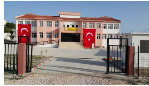
Görsel 2 : Yeni Okul Binamız

Okulumuzda Çağdaş, bilimsel ve milli manevi değerlere uygun eğitim verilmekte olup sosyal, sportif faaliyetlerle içerik zenginleştirilmektedir. Öğrencilerimiz katıldıkları yarışmalarda çeşitli dereceler elde etmektedir. Boccia, Okçuluk, Futbol, Voleybol, Basketbol, Kros, Uzun Atlama, Taekwondo dallarında sportif etkinlikler yapılmaktadır. Bilimsel çalışmalar kapsamında da 4006 TÜBİTAK Projeleri hazırlanmakta en son 2018-2019 Eğitim öğretim yılında bilim şenliği düzenlenmiş olup 2019-2020 hazırlıkları